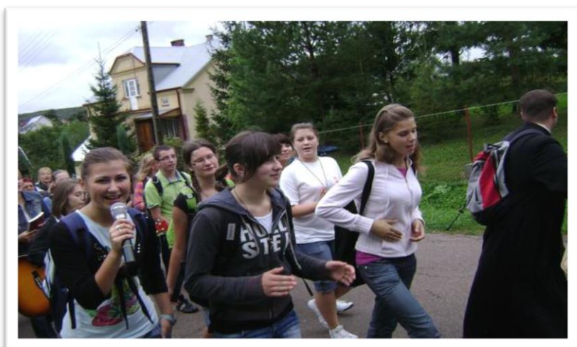
KSM Jedlicze 2011